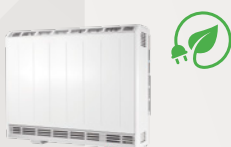
XLE Piece akumulacyjne