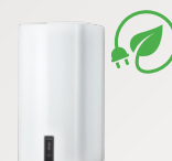
DHWE Podgrzewacze wody