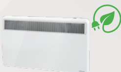
PLX E Grzejniki konwektorowe