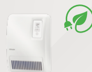
H 260E Grzejniki łazienkowe